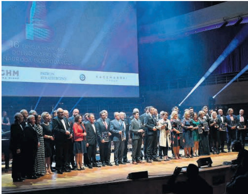
Podczas Wielkiej Gali Biznesu 2019 wręczono siedem statuetek oraz dwa wyróżnienia

- Uważam, że jest to nagroda szczególna, gdyż posiada zdolność predykcji. Zawsze doskonale czuła też puls rynku. Na początku Dolnośląski Gryf był wręczany wielkim przedsiębiorstwom z tradycjami i dużym budżetem. Teraz nagrody